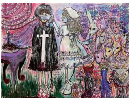
《お迎え》2024 Acrylic on Canvas (Live Painting)