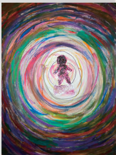
《ぼくの核》2024 Mixed Media