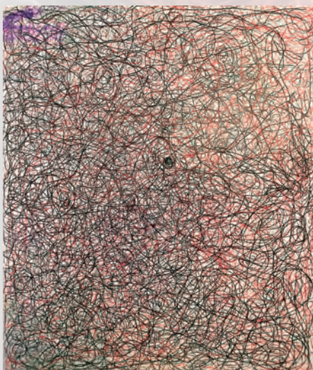
《会話》2024 Acrylic on Canvas