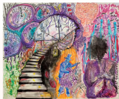
《ぼくの壊れた時間の概念》2024 Acrylic on Canvas (Live Painting)