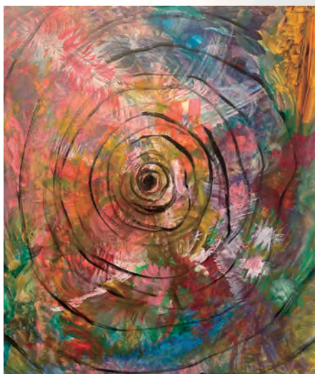
《宇宙通信》2024 Acrylic on Canvas