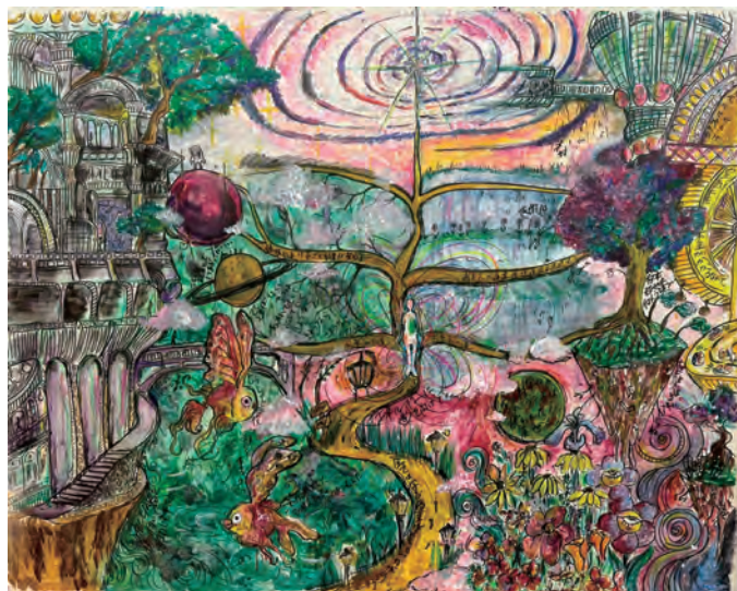
《汚染されたレムリア》2024 Acrylic on Canvas (Live Painting)