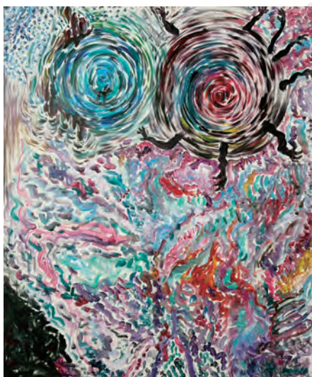
《準備運動》2024 Acrylic on Canvas