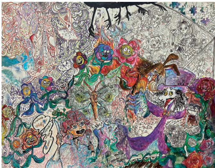
《無題》2024 Acrylic on Canvas (Live Painting)